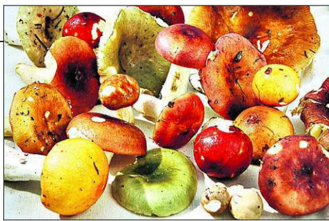
Kremlene opptre i alle farger. Den store bakerst og de fire til venstre i bildet er sildekremler. Forøvrig også grønnkremle, gulrødkremle, nøttekremle og vinrødkremle.