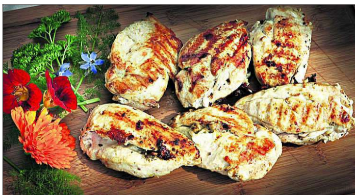
Kyllingbryst fylt med sopp og chèvre.

Skav ut innmaten i squashen. Stek finkuttet blandingsopp. Bland inn noe squashkjøtt i små terninger. Dryss med litt hvetemel og spe med litt fløte. Smak til. Bruk gjerne urter – timian og persille smaker ekstra godt sammen med sopp. Fyll squashen med blandingen. Stekes i ovn på 200 grader til squashen er al dente, ca. 30–45 minutter.