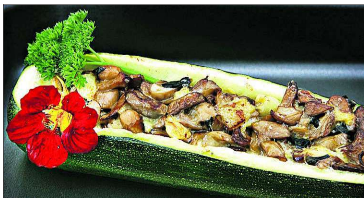
Squash fylt med soppstuing.